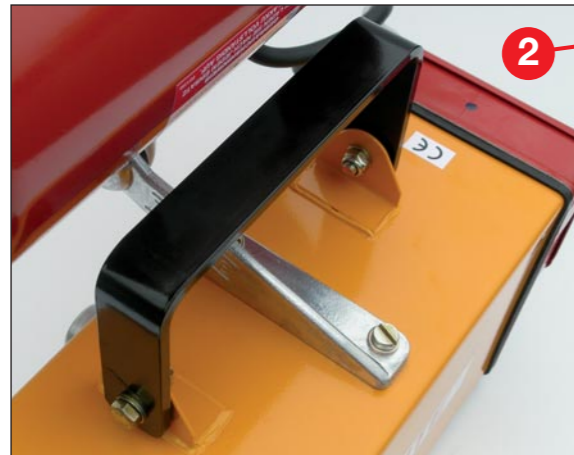
Stabiler klappbarer Handgriff.