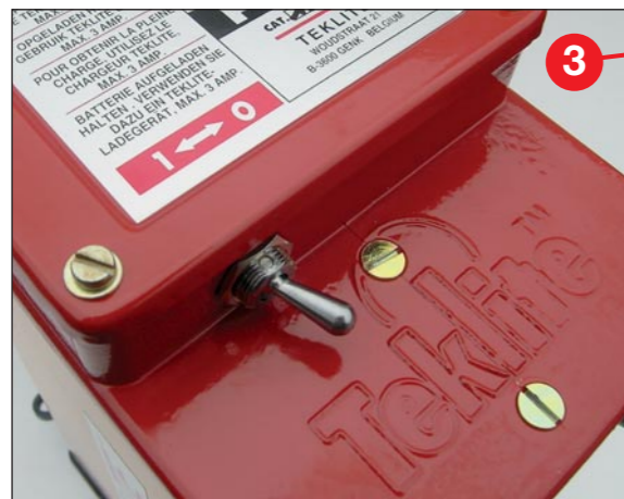
Eingebaute Vorschalteltronik mit ON/OFF Schalter.