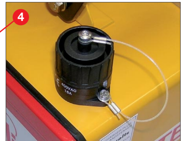
Binder Steckdose für das Teklite Ladegerät um die 12 Volt 12 Ah Batterie aufzuladen Lackierung : Gelb RAL 1007 Rot RAL 3000