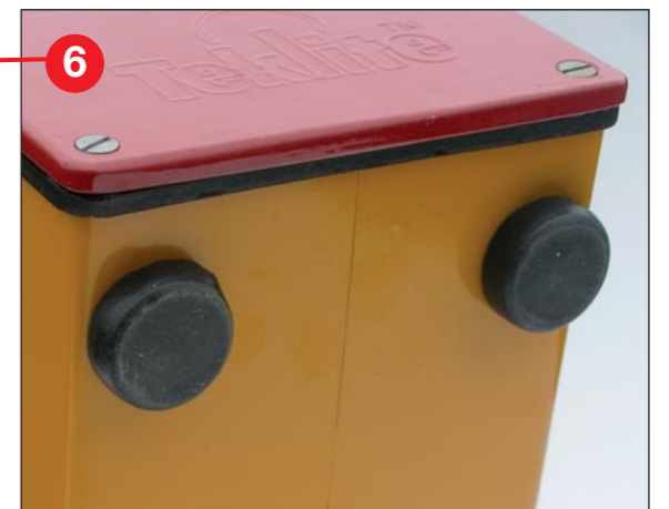
Solide Gummi Kappen für eine gute Standsicherheit