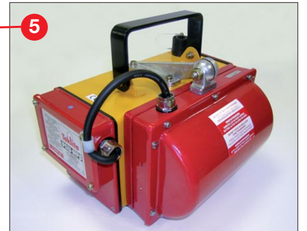
In geschlossener Stellung ist der Scheinwerfer gegen Beschädigungen geschützt