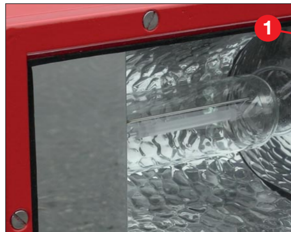
70 Watt, 12 Volt HDN (Hochdruck-Natrium) Leuchte. Scheinwerfer Schutzklasse : IP65